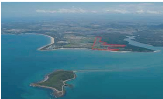
Shoal Point Bay Estate 索罗湾项目

ONE OF THE DEVELOPMENTS Over 400 prime sites with high demand.