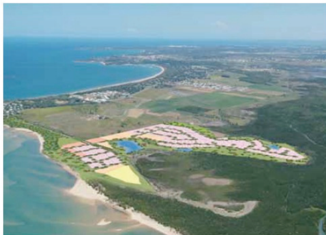
One of the Beachfront Developments Mackay Queensland